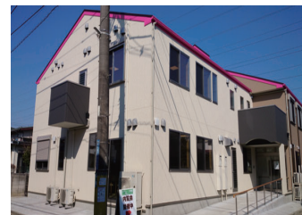
ムート綱島 アクア綱島デイサービス