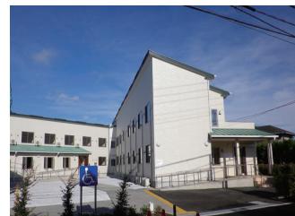
ムート水郷田名 アクア水郷田名デイサービス