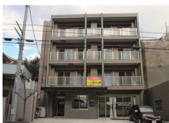
ムート横山公園 アクア横山公園デイサービス