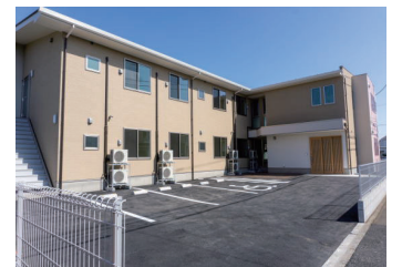
アクア陽光台グループホーム