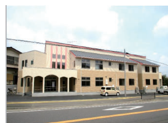
アクア淵野辺グループホーム