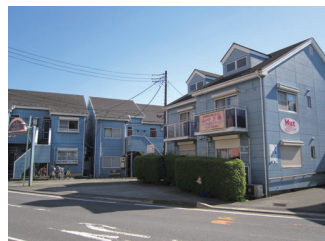
ムート上溝 アクア訪問介護ステーション