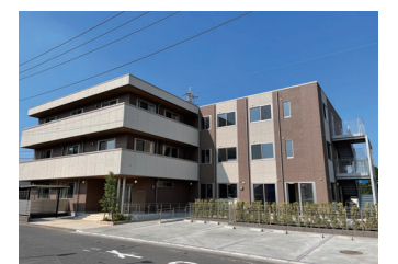
さんさん(燦燦)大和 アクア大和デイサービス