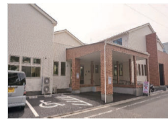
アクア相模原6丁目