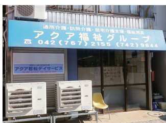
アクア若松デイサービス