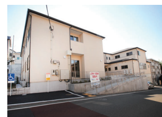
ムート座間くりはら アクア座間くりはらデイサービス