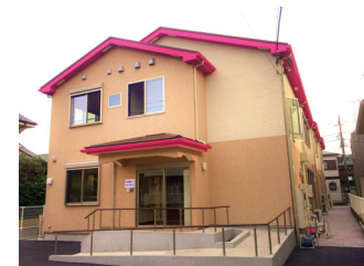
アクア東林グループホーム