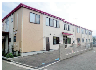
アクア大島グループホーム 小規模多機能ホーム アクア大島