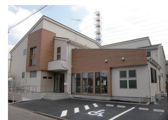
ムート矢部 小規模多機能ホーム アクア矢部