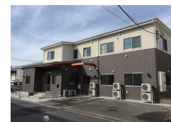
アクア上鶴間グループホーム